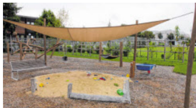
Auch schwerkranke Kinder brauchen Auszeiten zum Spielen